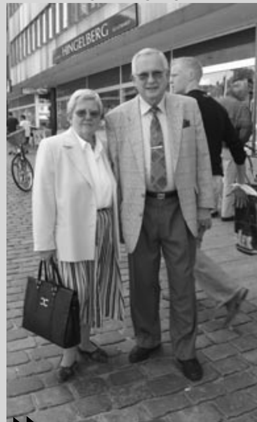
Vores mening om unge og alkohol:

» De unge er gode nok. De er dygtige, og de er flittige, men de drikker som et hul i jorden. Man frygter, at de ender som en flok drankere. Forældre burde sige stop, men det gør de jo ikke i dag. Det er lettere bare at lukke øjnene.